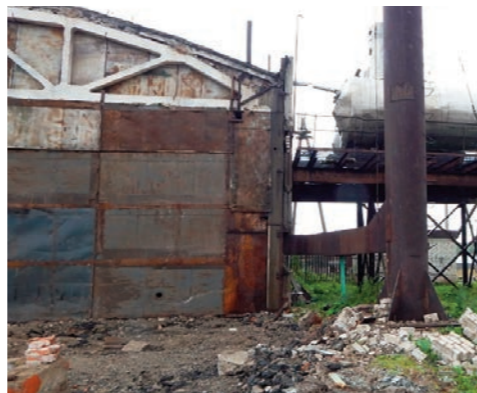
Котельная №0604 Филипп-Сола после демонтажа строительных конструкций