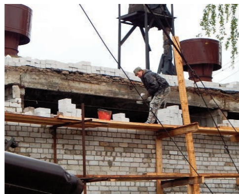
Строительные работы на котельной №0603 Поян-Сола