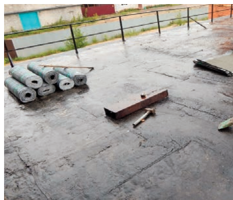
Кровельные работы котельная №0612 Кужмара

Устройством мансарды на административном здании Звениговских ТС – занимается подрядная организация – ООО «Стройпрофиль». Для наименьшего ущерба и нормальной текущей работы весь график разбит на три этапа. Работы по устройству мансарды предполагается закончить 16.09.15г.